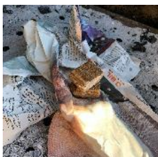
Ta bort grillgallret. Lägga 1-2 tändkuber på en tidningssida.

Grillar är inte tillåtna på uteplats eller balkong, men grillarna på gården är stora nog åt många! I skåpet bredvid finns tändkuber och grilltänger – lånar man något ser man förstås till att också diska efter sig. Man tar med egen kol/briketter, men det är varmt välkommet att grilla efter varandra så länge vi håller avstånd. Föräldrar ansvarar för att barn inte kommer nära heta grillar. För dig som vill avstå tändvätskedoft är här en instruktion hur man använder tändröret: