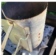
Fyll tändröret med kol, ställ ovanpå tändkuber.