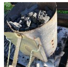
Vänta tills det är glöd (15-25min) – håll ut, fördela, lägg på grillgaller - grilla!