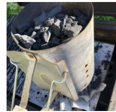
Vänta tills det är glöd (15-25min) – håll ut, fördela, lägg på grillgaller - grilla!