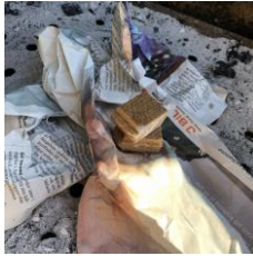
Ta bort grillgallret. Läg 1-2 tändkuber på en tidningssida.

Grillar är inte tillåtna på uteplats eller balkong, men grillarna på gården är stora nog åt många! I skåpet bredvid finns tändkuber och grilltänger – lånar man något ser man förstås till att också diska efter sig. Man tar med egen kol/briketter, men det är varmt välkommet att grilla efter varandra så länge vi håller avstånd. Föräldrar ansvarar för att barn inte kommer nära heta grillar. För dig som vill avstå tändvätskedoft är här en instruktion hur man använder tändröret: