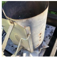
Fyll tändröret med kol, ställ ovanpå tändkuber.